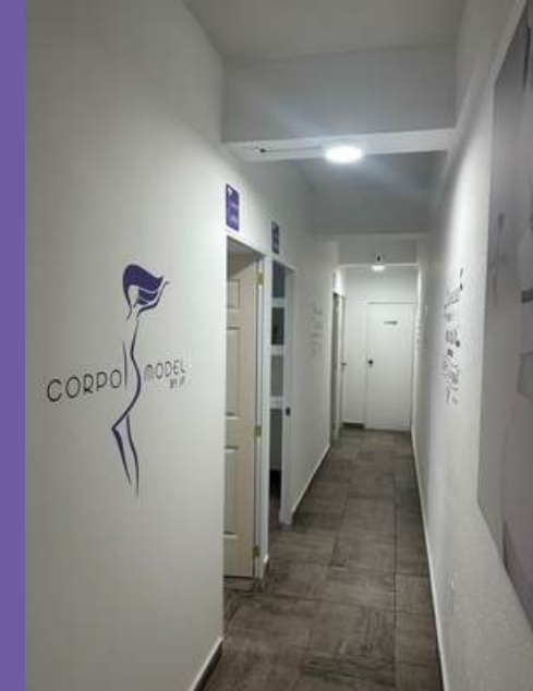
Franquicia San Jerónimo CDMX