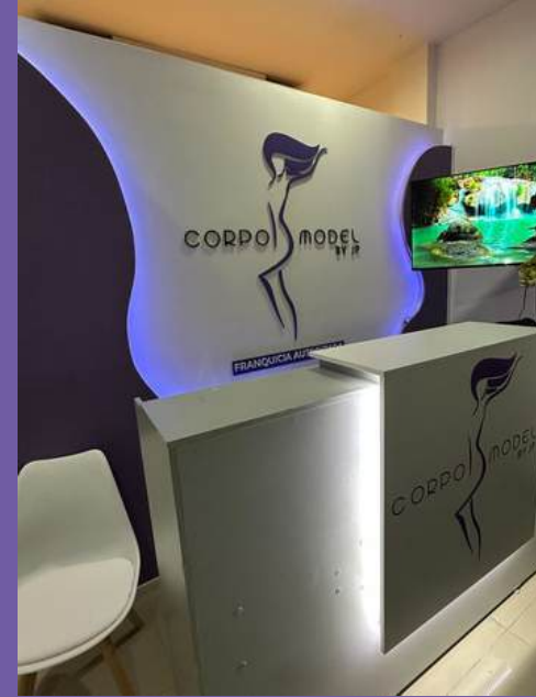
Franquicia Real del Valle Mazatlán, Sin.