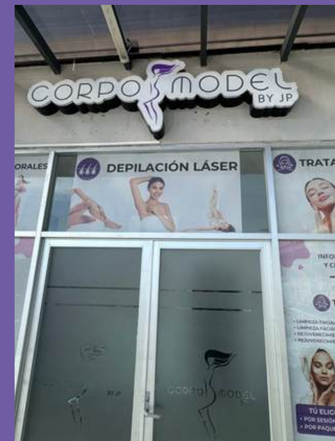
Franquicia El Jacal Querétaro