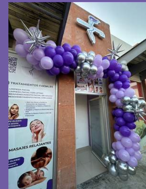
Franquicia CHAPULÍN Saltillo