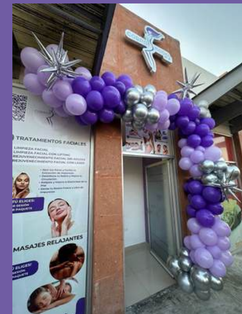
Franquicia CHAPULÍN Saltillo