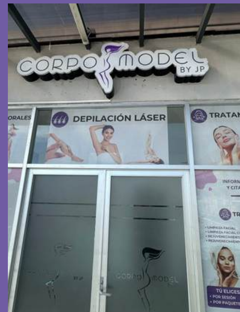
Franquicia El Jacal Querétaro