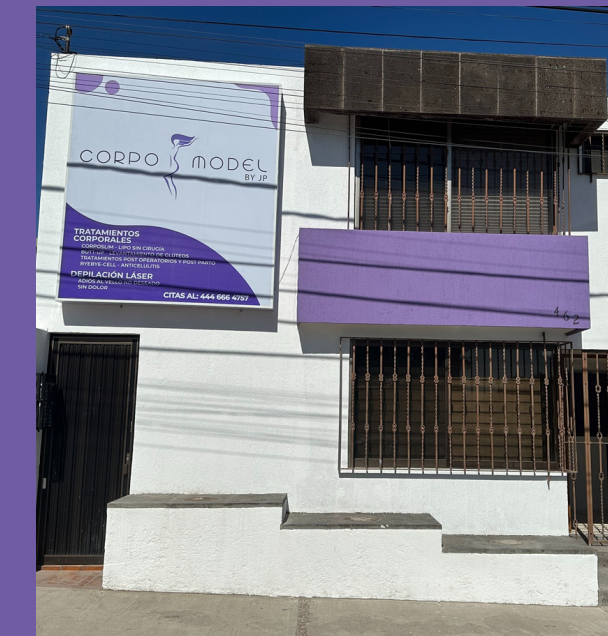
Franquicia LOMAS San Luis Potosí