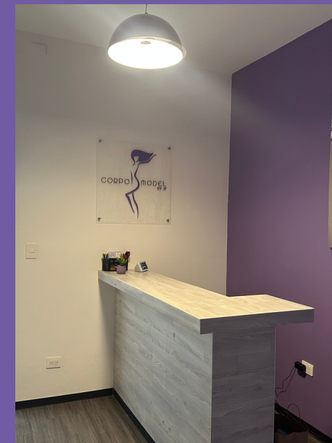
Franquicia Del Valle CDMX