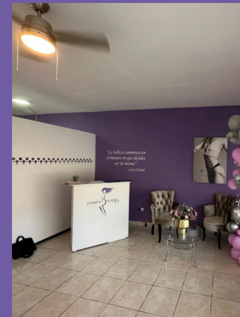
Franquicia MADERO Monclova