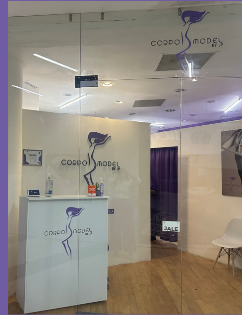
Franquicia PABELLÓN Zapopan, Jal.